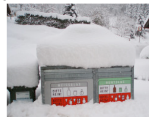
Schnee im Altglas stört Glasrecycling

Die weiße Pracht lässt viele Herzen höher schlagen. Manch Herz schlägt bloß schneller, denn nicht überall löst Schnee reine Freude aus. Glasmacher stehen vor besonderen Herausforderungen, wenn Altglas geist oder beschneit geliefert wird. Feuchtigkeit verändert die Glasschmelze sehr stark, das Recycling wird gestört.