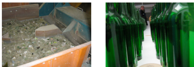
Aus Scherben werden wieder Glasflaschen – perfektes Bottle-to-Bottle-Recycling

Glasfahrer kennen Glaswerke gut – oft allerdings nur von außen, wenn sie die heikle Fracht Altglas anliefern. AGR und Vetropack luden Mitte Oktober rund 15 Glasfahrer ein, den „heißen Teil“ des Glasrecyclings in Pöchlarn hautnah zu erleben. Von der wohlbekannten Anlieferung (diesmal aus der zu-Fuß-Perspektive) über Sortierung, Produktion und Qualitätskontrolle machten sich die TeilnehmerInnen ein Bild davon, was mit ihrer Fracht passiert: