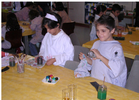
Ritzen und Bemalen von Glasverpackungen – kreatives Programm für Kinder in der Bobby Bottle-Galerie

Die Werke konnten 14 Tage lang besichtigt werden, Schulklassen erwartete ein ganz spezielles Programm mit Glasritzen und –bemalen.